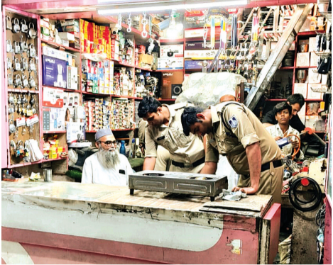
चाकूबाजी के आरोपी का पुलिस ने निकाला जुलूस, पुरानी इटारसी से गिरफ्तार, दो अन्य आरोपी भी गिरफ्तार

बढ़ती चाकूबाजी की घटनाओं को गंभीरता से लेते हुए पुलिस प्रशासन अब सख्त एक्शन मोड में आ गया है। मंगलवार को पुलिस ने चाकूबाजी के आरोप में गिरफ्तारी की वही आरोपियों का जुलूस भी निकाला।