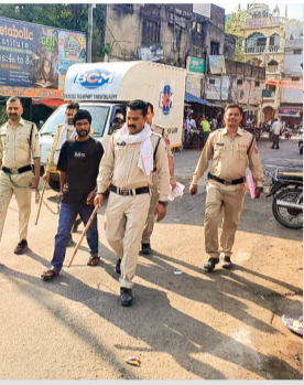
मामले की जांच की जा रही है। नौबत के परिजनों को कार्यलय बुलाया है।

पुलिस की इस त्वरित कार्रवाई से व्यापारियों और असामाजिक तत्वों के बीच हड़कंप मच गया है। स्थानीय नागरिकों ने पुलिस के इस कदम की सराहना की है। माना जा रहा है कि जमीनी स्तर पर की गई यह चेकिंग और कड़ाई शहर में बढ़ते अपराधों पर लगातार कसने में बेहद प्रभावी साबित होगी।