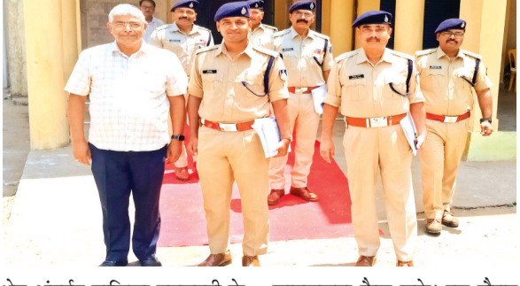
क्षेत्र अंतर्गत बालिका गुमशुदी के सभी प्रकरण निपटारे जाएं।