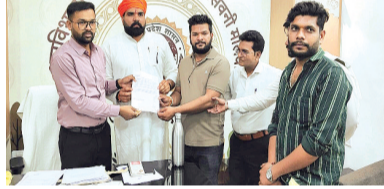
मांगी गई जानकारी भी उपलब्ध नहीं कराई जा रही है।